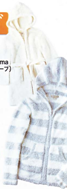
ヘアフット ドリームス ¥14700 / トコバシニック

100%ポリエステルで、カシミアのような柔らかな素材感。こちらは4〜6歳の子供用バスローブ。「スキンケアの邪魔にならないよう、ぴったり肌にフィットする感じが欲しいから、あえて子供用を購入。モチモチとした肌触りが◎」