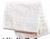
メイド・イン・アース オーガニックコットン フェイスタオル ¥1470

天然スクワランオイル配合のビスコース素材。殺菌作用があるので、ニキヒや吹き出物ができたときにもオススメ。「吸水性がいいので、そっと押さえるだけで水気が取れます。これで髪を乾かすと髪がしっとりする万能なタオル」