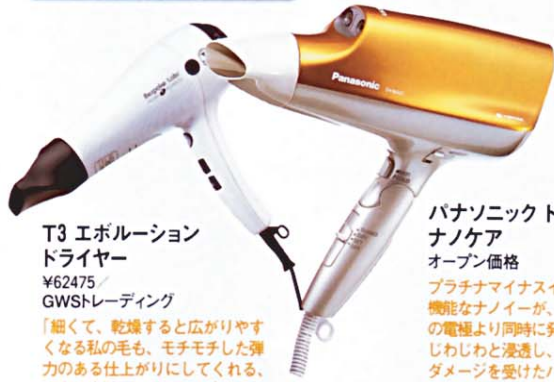
T3 エポリューション ドライヤー ¥62475 / GWSTレーディング

「細くて、乾燥すると広がりがやくなる私の毛も、モチモチした弾力のある仕上がりにしてくれる、まさに奇跡のドライヤー」。マイナスイオンと遠赤外線効果を含んだ、柔らかい風を噴射。風量温度調節も、7段階の微調整が可能。